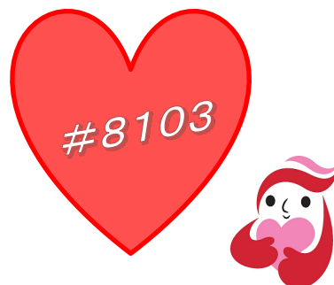
犯罪被害者等支援シンボルマーク 「ギョuttoちゃん」

性犯罪の被害に遭われた方が相談しやすい環境を整備するため、各都道府県警察の性犯罪被害相談電話窓口につながる全国共通の短縮ダイヤル番号(#8103)を導入したものです。ダイヤルすると発信された地域を管轄する各都道府県警察の性犯罪被害相談電話窓口につながります。