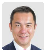
鈴木 英敬氏 三重県知事