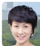
伊東 敏恵氏 NHKアナウンサー