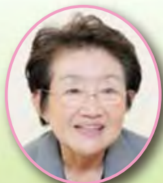
有馬真喜子 UN Women 日本国内委員会理事長