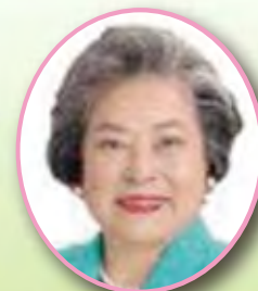
堂本 暁子 前千葉県知事・元参議院議員