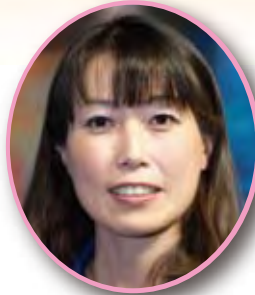
山崎 直子 宇宙飛行士

ホルダー・トブソ(デンマーク)の 主席化学プロセス技術者 化学プラント・総合資源エネルギーの 科学博士 合成ガス・石油化学分野での専門職 スペイン(マドリッド)で生まれ学位を取得後 1984年からデンマーク(コペンハーゲン)に在住 1985年結婚 2児(18歳・14歳)の母