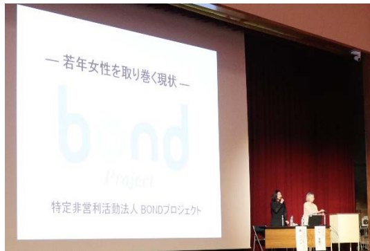
啓発シンポジウム（女子高）