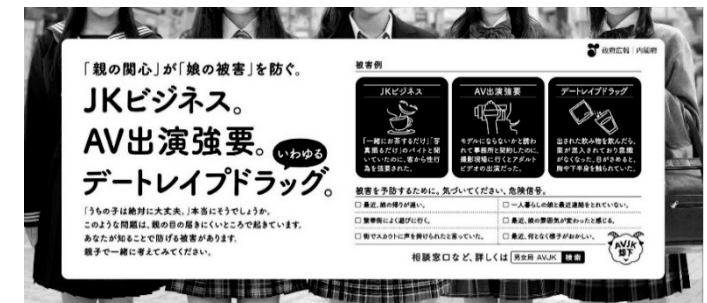
新聞記事下（平成30年3月24日）