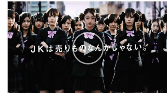
被害防止動画（JKビジネス）