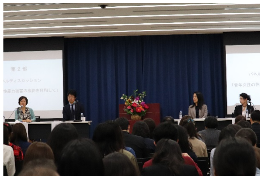
啓発シンポジウム（大学）