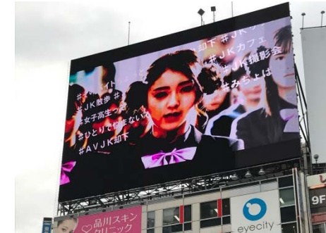
街頭ビジョン（シブハチ）