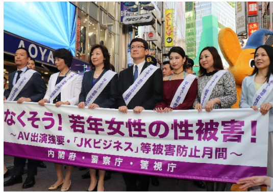
街頭キャンペーン