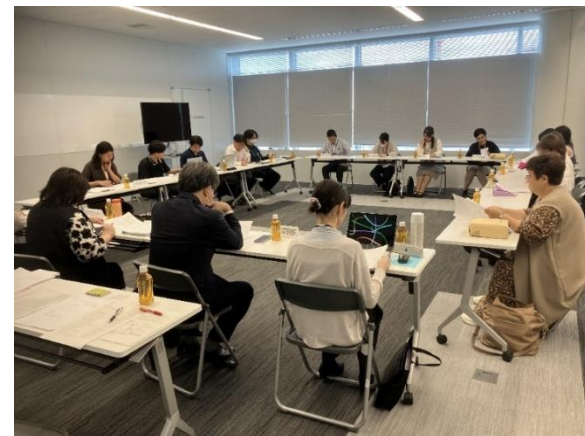
ネットワーク会議の様子