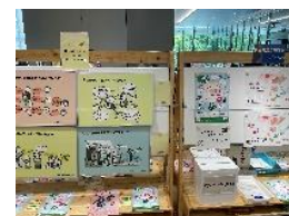
男女共同参画週間パネル展

区報の掲載、掲示板の活用、子育て世帯へのメール配信、区公式SNS、イベントでの周知