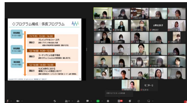
オンライン研修の様子(係長相当クラス)