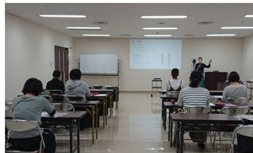
②ビジネスマナー編9/13（火）