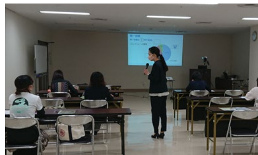
②ビジネスマナー編10/25（火）