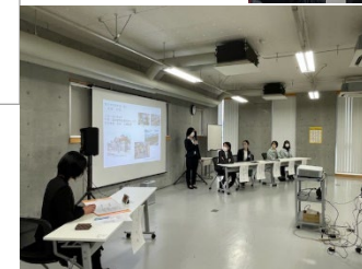
トークイベントの様子