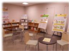
あんしんつながりステーション岐阜駅東