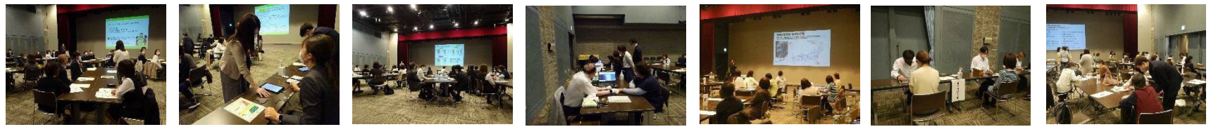
カゴメ株式会社／野菜の推定摂取量測定 クラシエホールディングス株式会社／毛細血管画像測定 株式会社資生堂／自律神経活動測定、「腸活」度セルフチェック