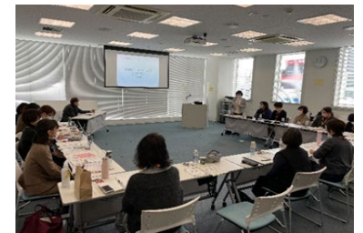
<相談対応スキルアップ研修会>