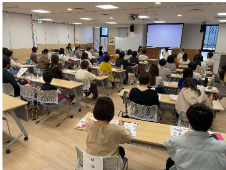
【前年度までの受講生によるトークセッション】 受講前と受講後の変化や受講して感じたこと、 卒業後の働き方などについてトークセッション を実施