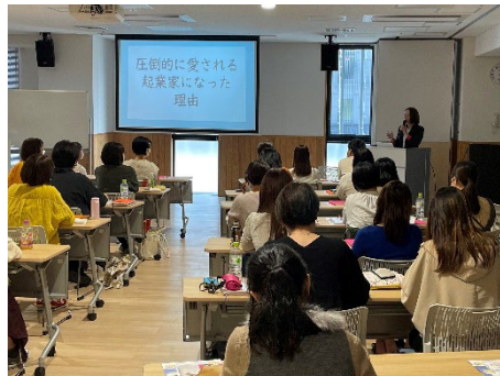
【女性起業家によるセミナー】 新しい働き方として「起業」の選択肢を増やし てもらう。雇用される働き方との違い、メリット やデメリットについての講話を実施