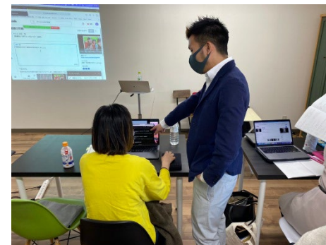
【動画クリエイター講座】 YouTubeなどの動画編集が可能となるレベル を目標に講座を開催。実際の仕事では撮影か らの依頼もあることから、撮影機材に触れるな どの撮影ワークも取り入れ実施