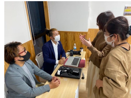
【質問相談会】 起業について、在宅ワークについて、講座受 講について等の質問や相談が気軽に出来る ブースを設置。連携機関への相談は希望をき き、個別相談を斡旋