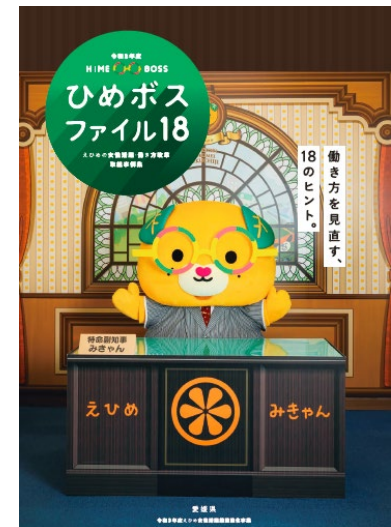
取組事例集 「ひめボスファイル18」