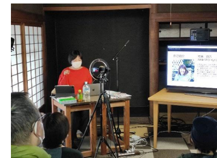
個人向けセミナー風景