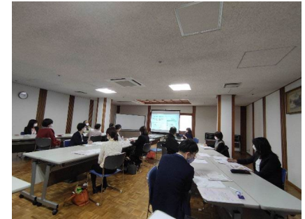
コアメンバーミーティング風景