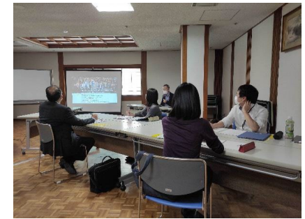
企業向けセミナー風景