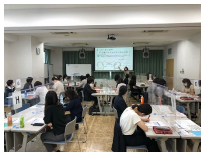
女性社員向けキャリアアップセミナー

女性自身の意識改革や必要なスキルの習得のための講座や、女性だけでなく男性も働きやすい職場環境の整備などを学ぶ男性管理職セミナーや、職場単位で理解を促進するための講師派遣型セミナーを実施した。