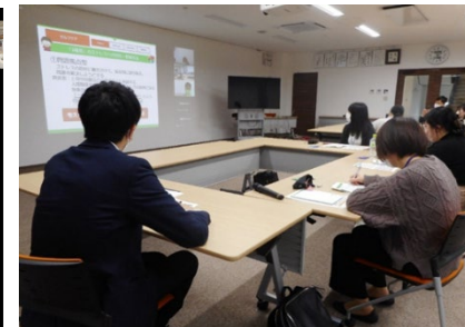
講師派遣セミナー