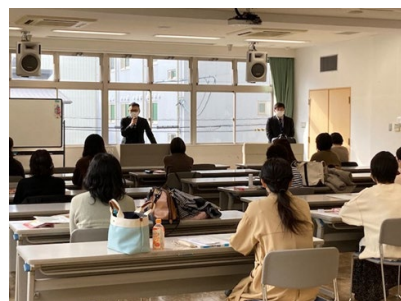
ファイナンシャルプランニング講座