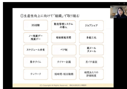
男性管理職向けセミナー(オンライン)