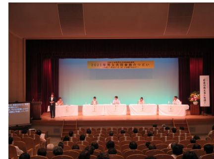
トモ活推進キックオフイベントの様子

家庭における役割分担に関するデータ、家事に関するアイデアを紹介するとともに、家庭内での取組を宣言できるリーフレットを作成し、主に企業で働く人に配布することで、「トモ活」の啓発と実践の促進を図る。