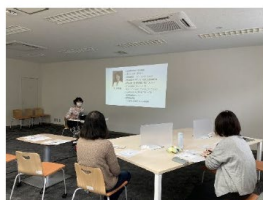
【10/7】Facebook のビジネスページ