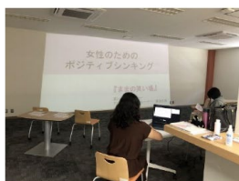
【10/26】笑顔につながる Positive thinking