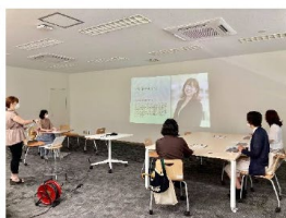
【7/30】伝わりやすい話し方講座