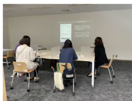
【7/5】LINE 公式アカウントの活用法！実践編