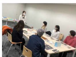
【12/7】夢に向かうためのカラーコラージュ講座