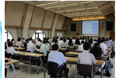
働き方改革セミナー受講風景