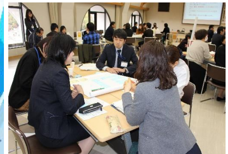
働き方改革セミナーグループワーク風景