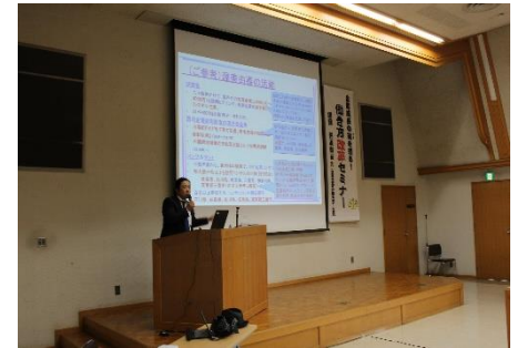
働き方改革セミナー講義風景