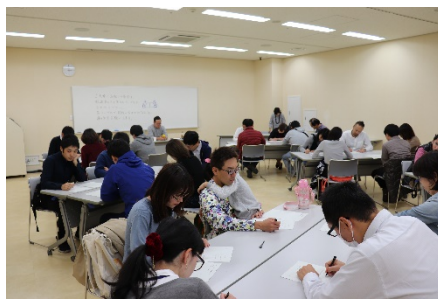
ワークショップ型男性向けトークセッション