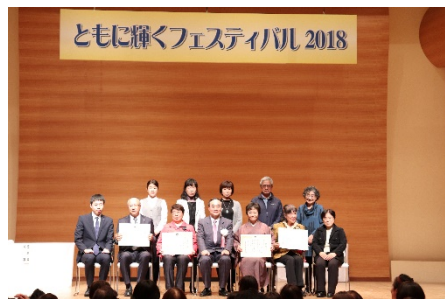
男女共同参画立県とくしまづくり表彰

〇とくしまフューチャーアカデミー ・女性活躍に関する実践的な研修等を一連の流れの中で実施 ・キックオフセミナーにおいて、講演パネルディスカッション、ワークショップを実施 ・研修において、それぞれグループディスカッションを含めた内容で講義を実施 ・研修の成果を最終回において受講者プレゼンテーションを実施し、講評を受けた後、交流会において、他業種や公務員等との交流を図ることで、今後の活躍に向けたつながりを強化