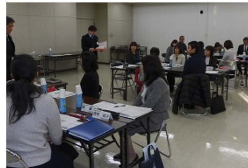
企画検討会議風景