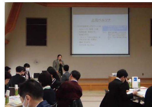
働き方改革セミナー講義風景