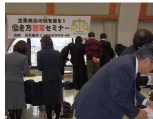
働き方改革セミナーグループワーク風景