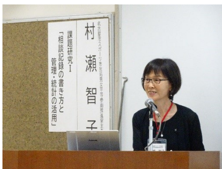
課題研究Ⅰ「相談記録の書き方と管理・統計の活用」

本研修では、事前に行われている基礎研修をオンラインで学びつつ、女性関連施設等におけるジェンダー視点に立った相談事業運営に係るマネジメント力や課題解決に向けた実践力、スーパーバイザー（カウンセリング初心者）が困難事例に陥った際に有益な、グループスーパービジョン（指導者から第三の視点で助言をもらうこと）による研究成果など、多様な相談に対応できる力を学びました。