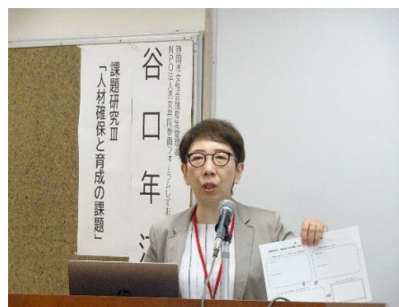
課題研究Ⅲ「人材確保と育成の課題」