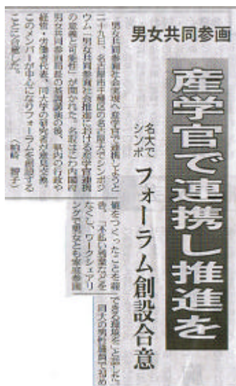
(2003 年 9 月 30 日中日新聞より)

ネットワーク～」と題して、内閣府が進めているチャレンジ支援の概要と今後の取り組みについての基調講演があり、その後のパネルディスカッションでは、各パネリストから各機関の男女共同参画に関する現状と取り組みや、男女共同参画のあり方等についての意見の発表の後、男女共同参画に関する産学官連携の意義について討論しました。