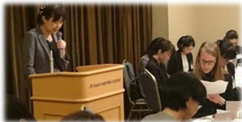
▲女性活躍推進セミナー(北海道)