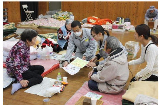
性暴力・DVを防止するためには、周囲の見守りの目も必要ということを説明し、啓発した