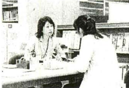
“女性再就職支援コーナー”