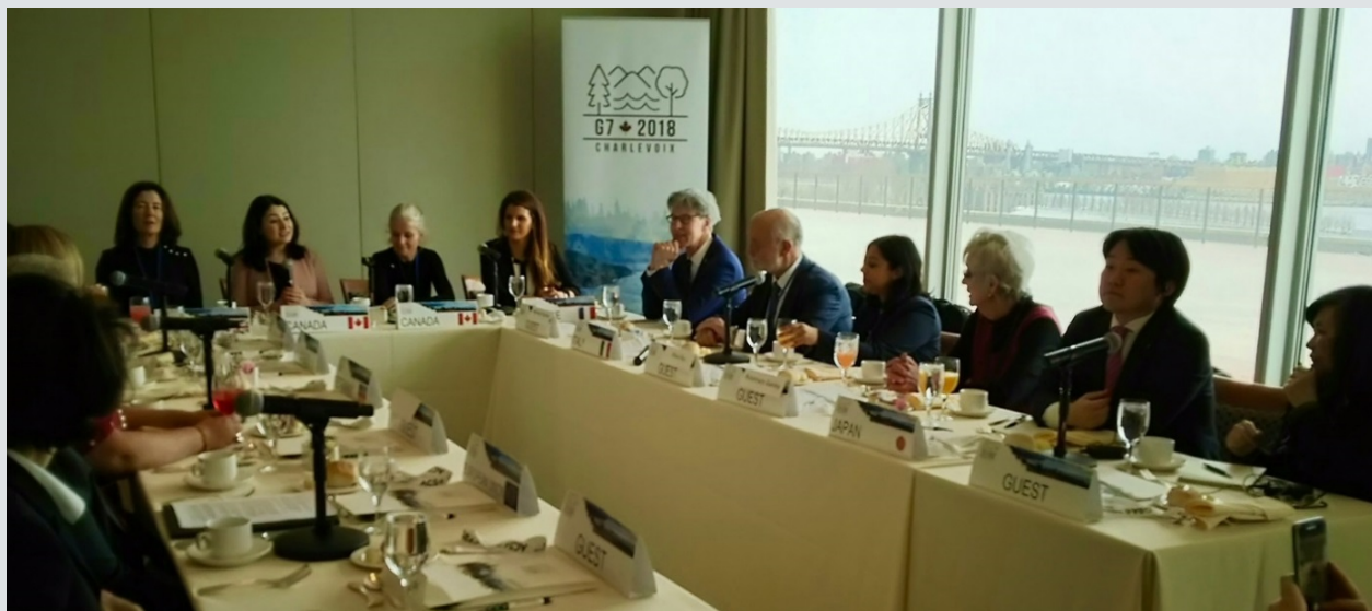
内閣府男女共同参画局