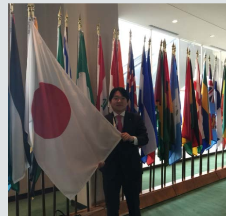
山下雄平内閣府大臣政務官