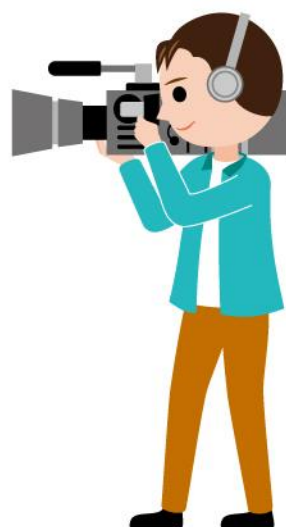
20_1テレビカメラマン男性