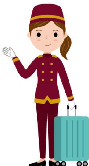
12_1ホテル従業員女性