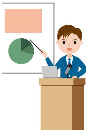
19_1演台に立つ人男性