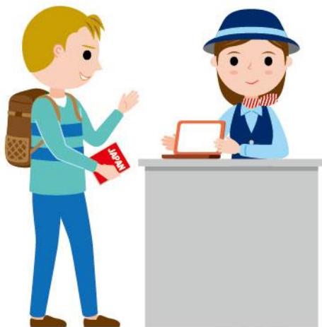
11_1外国人向け観光案内女性