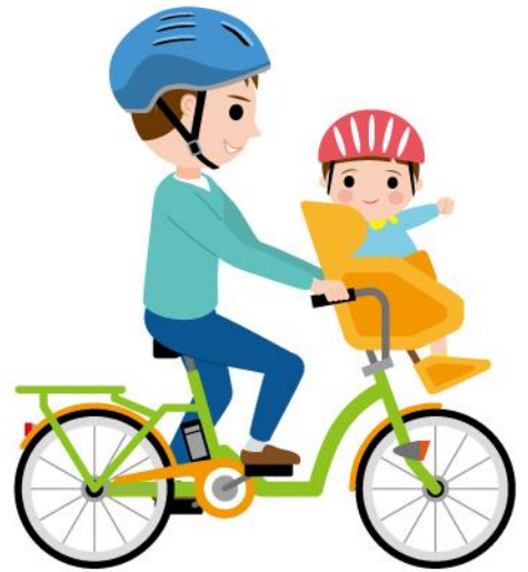
26_2乳幼児の送迎男性