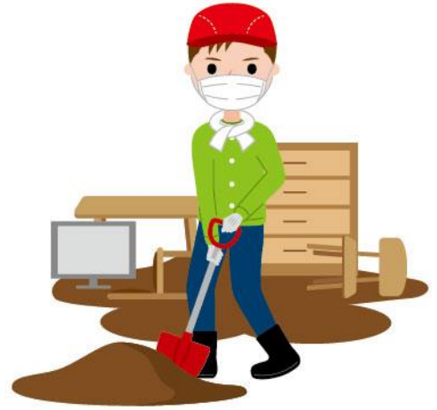
04_1防災ボランティア男性