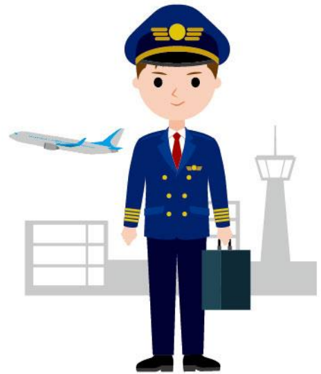
03_1飛行機のパイロット女性 03_1飛行機のパイロット男性