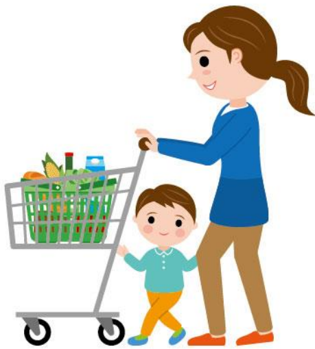
27_1食料品買い物女性