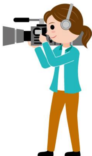
20_1テレビカメラマン女性