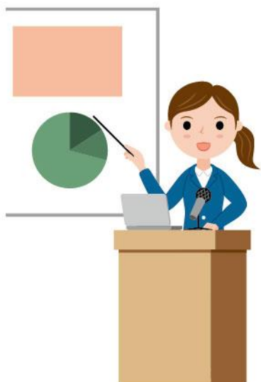
19_1演台に立つ人女性