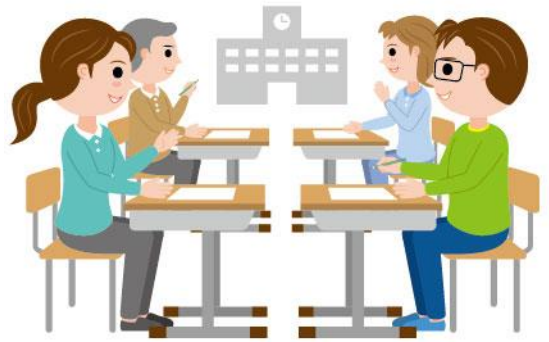
26_4保護者会への参加男性