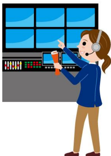
21_1テレビプロデューサー女性