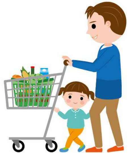
27_1食料品買い物男性