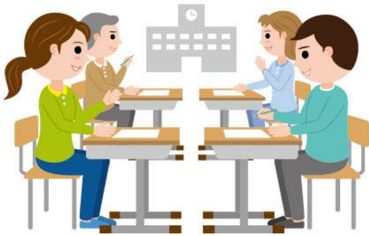
26_4保護者会への参加女性