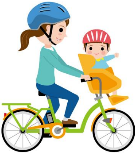
26_2乳幼児の送迎女性