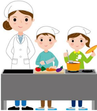
17_1家庭科の調理実習女性