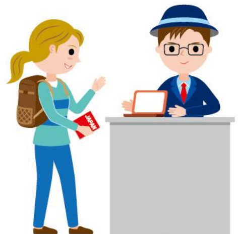
11_1外国人向け観光案内男性