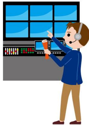
21_1テレビプロデューサー男性