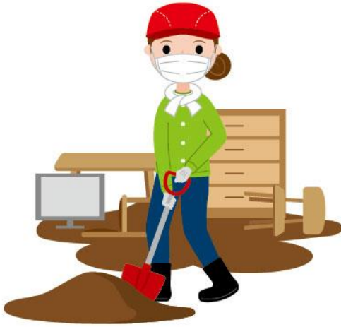
04_1防災ボランティア女性