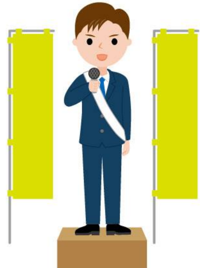
18_1立候補者議員男性