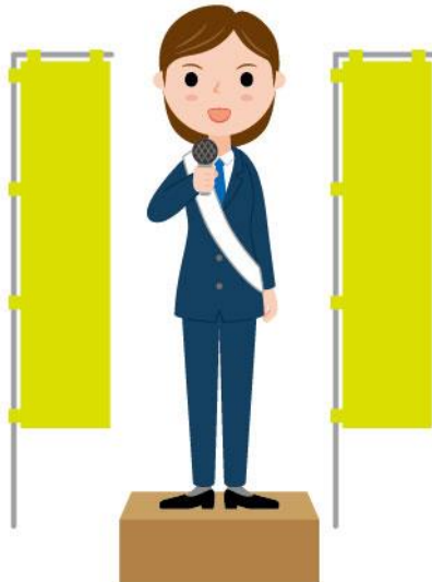
18_1立候補者議員女性