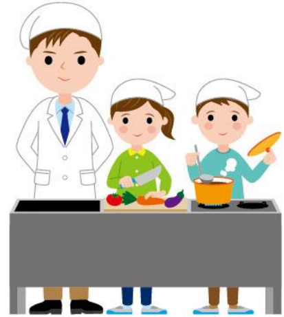
17_1家庭科の調理実習男性