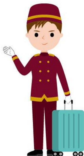
12_1ホテル従業員男性