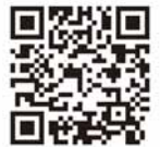
応募フォーム QRコード

* 受付完了後、受領印を押印のうえ、返信しますので、当日は、本参加証をお持ちください。