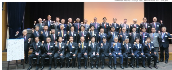
▲ 賛同者拡大ミーティングの様子