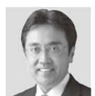
赤澤亮正(予定) 内閣府副大臣