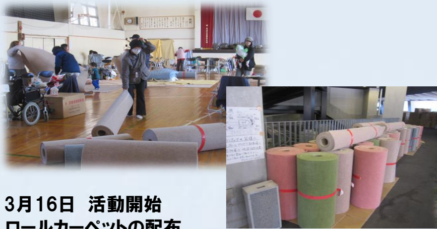
3月16日 活動開始 ロールカーペットの配布 自主的な小名浜地区各避難所支援

Work on the victim support that we performed from the direct next when a disaster occurred