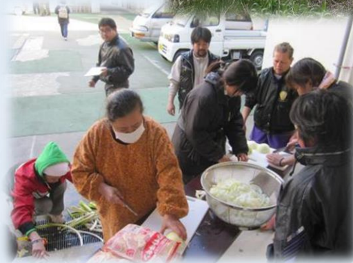
食を通じた被災者支援

activity to send relief supplies originally