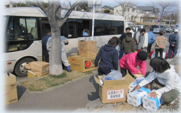
避難所に対する御用聞きスタイル での救援物資配布

activity to send relief supplies originally