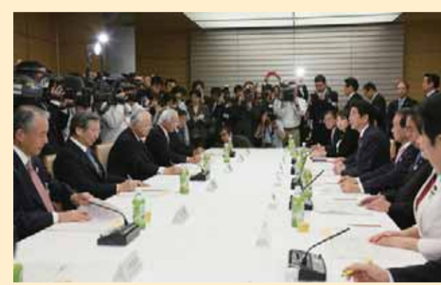
経済界との意見交換会であいさつする安倍総理（首相官邸HPより引用）