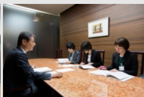
役員メンター運営