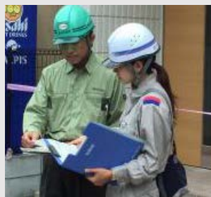
導管工事現場での活躍