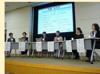
職場で活躍する女性社員によるパネルディスカッション