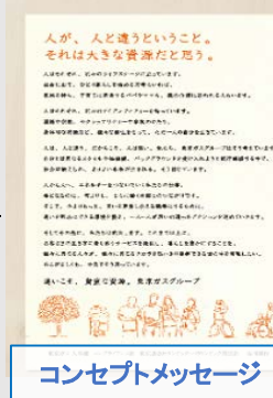
コンセプトメッセージ