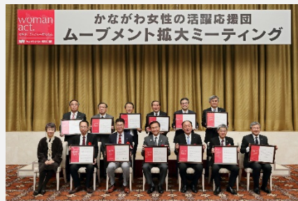
【かながわ女性の活躍応援団 ムーブメント拡大ミーティング集合写真】