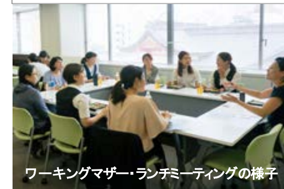
ワーキングマザー・ランチミーティングの様子