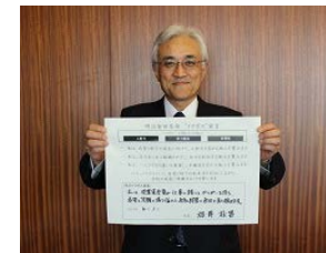
社長の「イクボス宣言」

2016年度より「働き方改革」をスタートし、会議・報告ルールの見直しや業務効率化等に取り組んでいます。これを強力に推進するエンジンとして、管理職の意識改革等を目的としたトップダウン型の「イクボス育成プログラム」を導入するとともに、全職員参加型の小集団活動を通じたボトムアップによる推進も強化し、「会社」「所属」「個人」それぞれが主導となって取り組む態勢を構築しています。なお、「イクボス育成プログラム」については、社長を含む、全役員、全管理職が「イクボス宣言」を実施し、それぞれの宣言内容を社内のイントラネットでも公開しています。