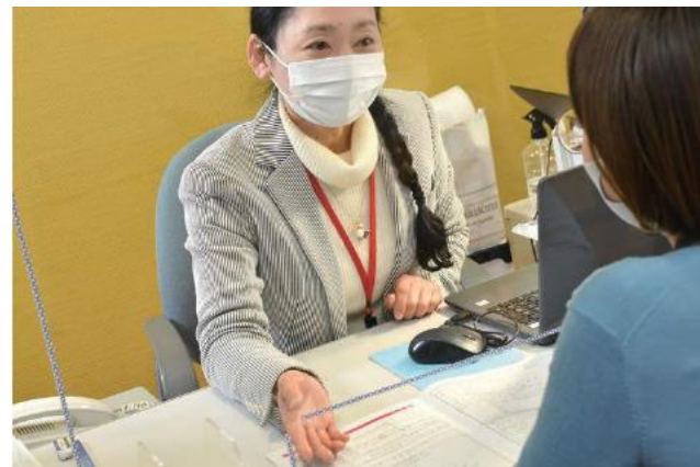
女性の就労サポーターが支援