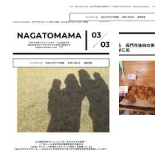
▲長門ママワーカー養成講座受講者執筆の「NAGATOMAMA」