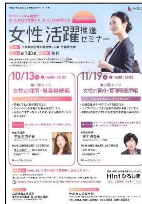
セミナー募集チラシ