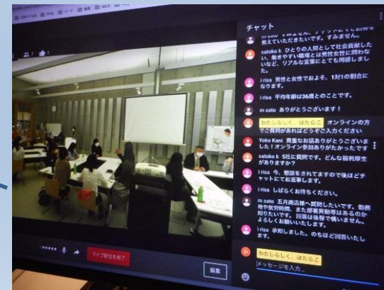
オンライン参加者からの質問はチャットで受付