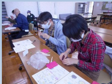
裁縫ワークの様子