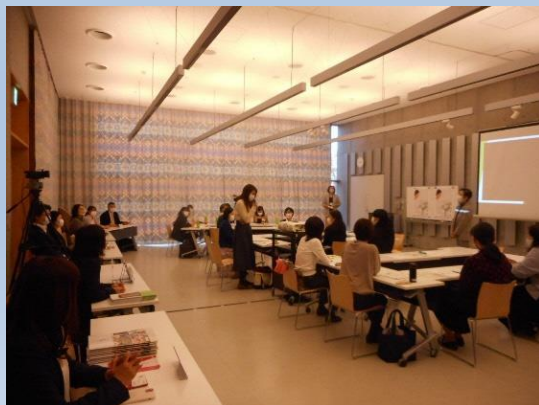
映像ツアー後に感想、質問をされる参加者

○参加企業での取り組みや、実際に働いている人の映像を見て、疑問に思ったことなどを各企業へ質問。各企業の人事担当者が回答。会場参加者からもオンライン参加者からも多くの質問が出、活発な意見交換となった。その後、実際に働く職員との交流会を開催。