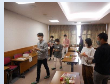
セミナーで ごみを分別して いる様子