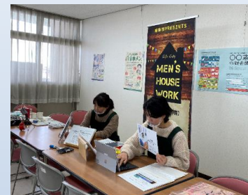
オンラインセミナーの様子