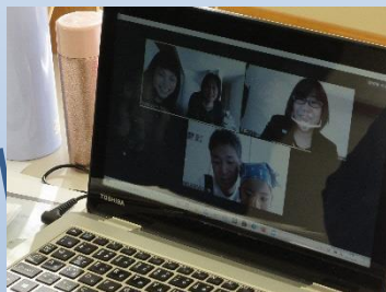
セミナーでのグループディスカッションの様子