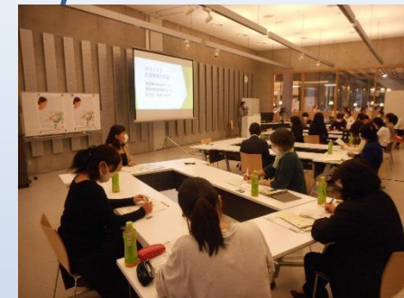
キャリア支援シート 「マイキャリアマップ」