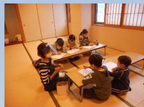
子ども達の 家事のワークショップ