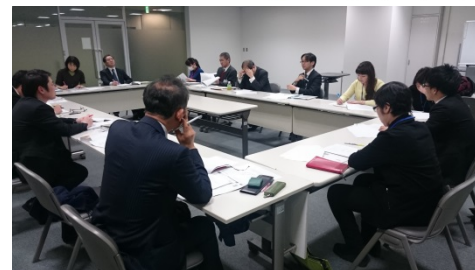
(H28年3月3日第1回部会の様子)