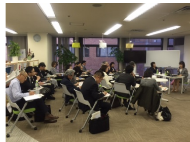
企業経営者向けセミナー