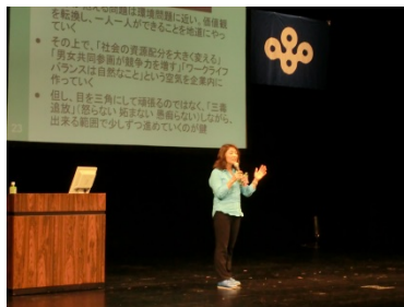
OSAKA女性活躍推進会議記念イベントと行動宣言