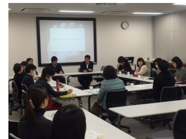
学生向けセミナー