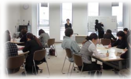
女性を対象としたスキルアップ研修