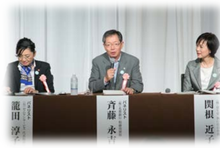
推進会議キックオフイベント