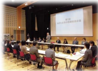
第1回「あきた女性の活躍推進会議」