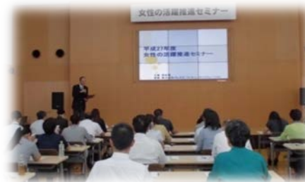
経営者等を対象としたセミナー