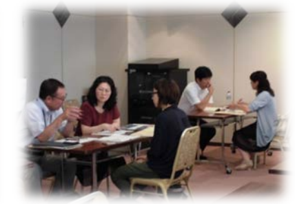
女性の起業支援セミナー(個別相談会)