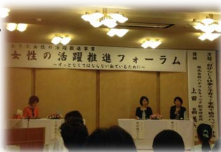
地域における意識啓発イベント(県南地区)