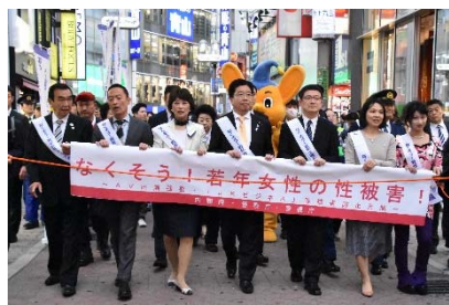
【啓発街頭キャンペーンの様子】