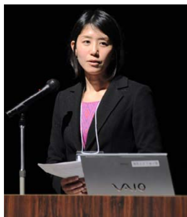
ふくい女性ネットメンバーからの報告