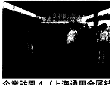
企業訪問4（上海通用金属結 構工程総公司）12日、上海