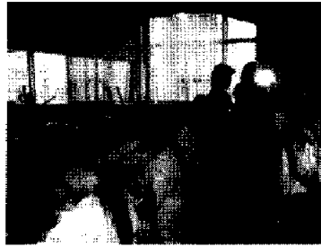
企業訪問2（北京千恵美容芸 術学校）11日、北京