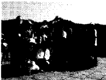
万里の長城 八達嶺 (9日、北京)