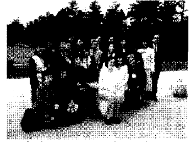
日本大使公邸を訪問（10日、 北京）