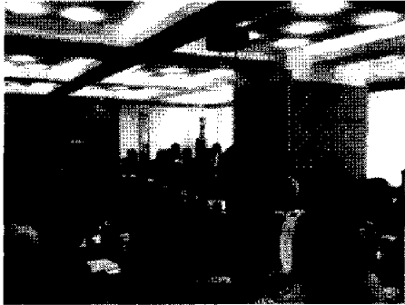
活発な意見交換が行われた座談会 (12日、上海)

全国商工会議所女性会連合会（全商女性連）のメンバーは、経済産業省の外郭団体である世界経済情報サービスとジェトロ厚生会が主催した「女性企業経営者等の日中交流訪中団」に参加、10月8日から6日間の日程で中国の北京と上海を訪問した。一行は中国女性経営者らと経営上の問題点や成功の秘訣などについて意見交換を行ったほか、女性経営者の企業視察等を行い、交流を深めるとともに、ビジネスチャンスを探った。