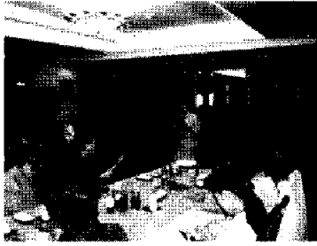
中国の女性経営企業についての講義（長安倶楽部） 10日、北京