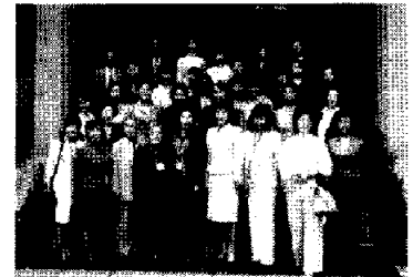
全国工商連メンバーの女性経営者の皆さんと (10日、北京)