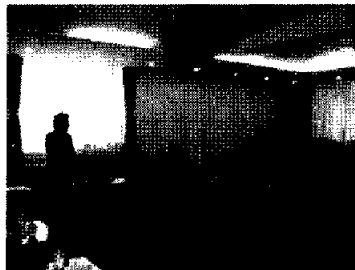
全国工商連 女性経営者座談会（齋藤団長挨拶） 10日、北京