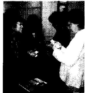
上海市工商連女性経 営者座談会（会合後の 名刺交換）12日、上海