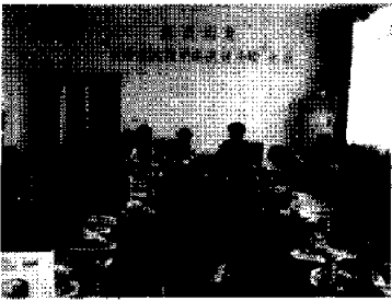
企業訪問3（上海美為宝化粧 品有限公司）12日、上海