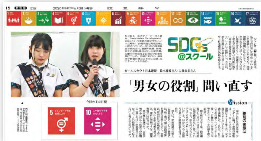
読売新聞掲載記事