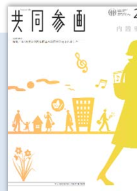
広報誌「共同参画」に掲載