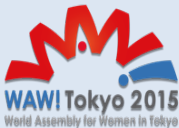
女性が輝く社会に向けた国際シンポジウム (27年8月)