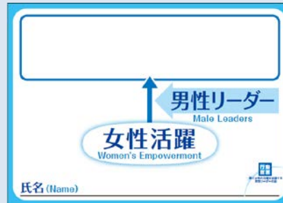
フリップボードを掲げる賛同者