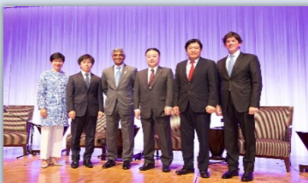
在日米国商工会議所 (ACCJ) イベントの様子 (27年6月)