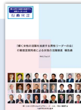
取組事例集を日・英二言語で作成